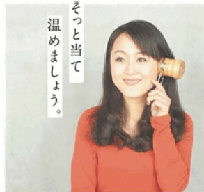
耳にそっと当て 温めましょう。