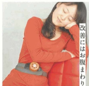
女性のお悩み 改善にはお腹まわりを。