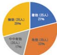
漢方薬が飲めた119名