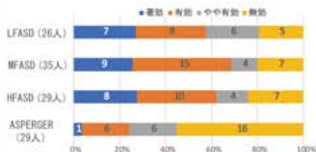
漢方薬を服用してきた119名の割合