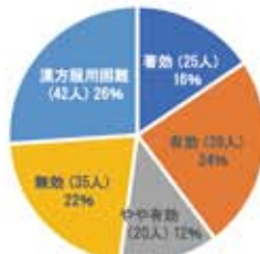
漢方薬を試した161名